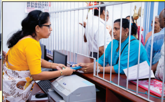
කළමනාකාරී ගනුදෙනු සිදුකරමින්.