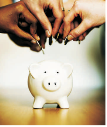
පුද්ගලයකු වන්නට අධිෂ්ඨාන කර ගන්න. සන්ධ්‍යා ජයකොඩි පීච්පන නගරය සභාස