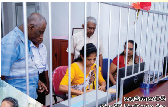
කළමනාකාරී කිරීන් විජේරත්න මිය පරගනකගන කිරීම