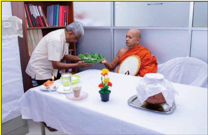
සේව පිරිතට ආරාධනා