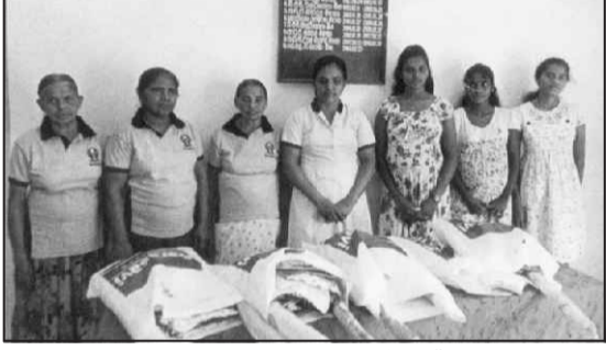
සටහන - එච්.කේ. ඇලපාන

2019 වසරේ පිංකම වෙනුවෙන් ගැබිණි මාතාවන් සදහා අවශ්‍ය, ද්‍රව්‍ය බෙදාදීමක් පසුගියදා සමිති ශ්‍රවණාගාරයේදී, සාමාජික සාමාජිකාවන්ගේ ප්‍රධානත්වයෙන් ජ්‍යෙෂ්ඨ සාමාජිකයන්ගේ සුරතීන් සිදුකරන ලදී.