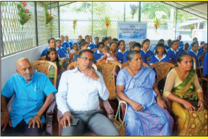
ආරාධිත අමුත්තන් හා සාමාජිකයින්