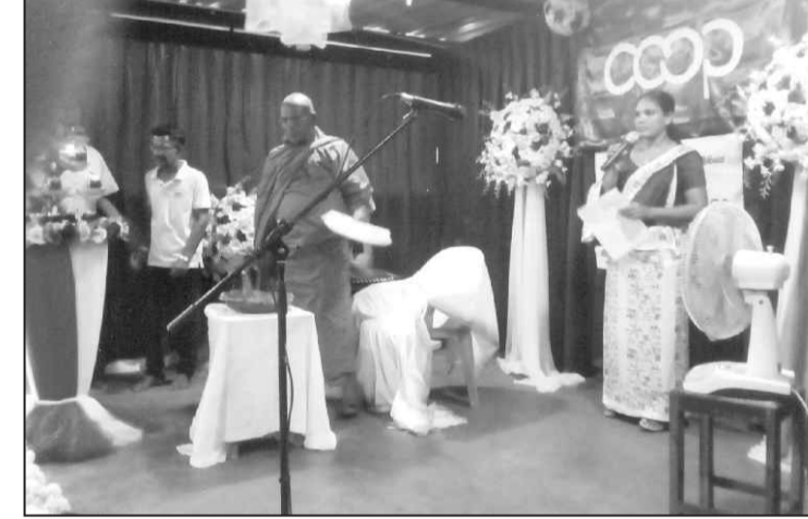
සටහන - කළමණාකාරී

මහත්මීන්ද වී අවස්ථාව සඳහා සහභාගි විය. මෙදින උත්සවය ළමා