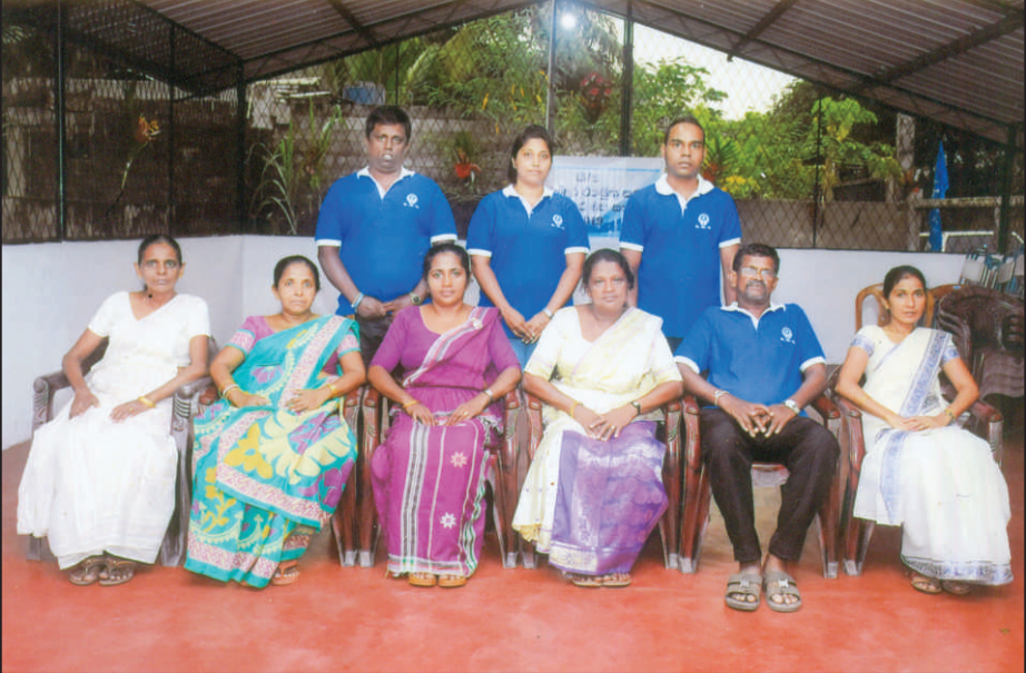
ගරු සභාපතිණිය සමග කාරක සභාව