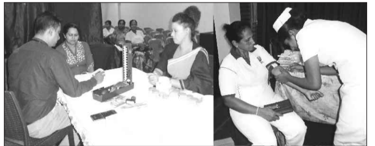
ඩී.පී.එස්. සියඹලාපිටිය වෛද්‍යතුමා වෛද්‍ය සායනයට දායකත්වය දක්වන ලදී. ඊට ස්තූතිය පුද කරමු.