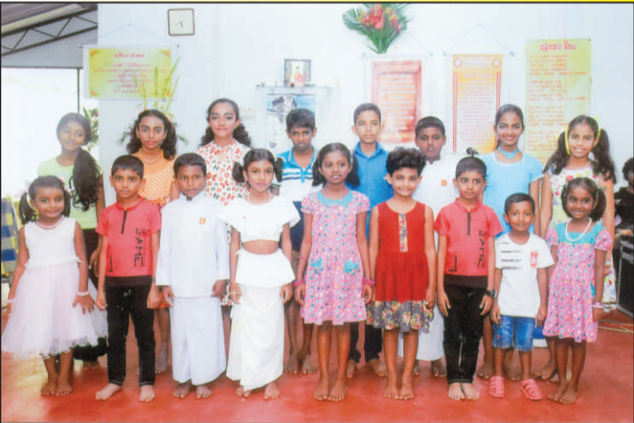
ප්‍රමා සමාජයේ දූ දරුවන්