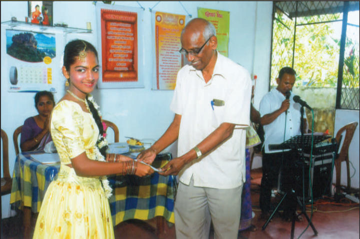
ඉදිරිපත් කිරීම වෙනුවෙන් ත්‍යාග ලබමින්