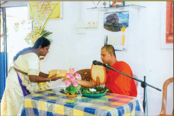
සභාපතිණිය විසින් පිරිකර පූජා කිරීම

බවට පත්වූයේ 1997 වසරේදීය. ආරම්භයේදී මෙහි සාමාජික සංඛ්‍යාව දස දෙනෙකුටත් අඩු අගයක පැවතිණි. එලෙස ඇරඹු ගමන් මගේදී ප්‍රදේශවාසීන්ගේ විශ්වාසය ක්‍රමයෙන් දිනා ගනිමින් අද වන විට ක්‍රියාකාරී සාමාජික සංඛ්‍යාව සියයකට ආසන්න සංඛ්‍යාවක් දක්වා වර්ධනය කරලීමට ලැබීම සතුවට කරුණකි. සී.ස. බටුවන්දර එකමුතු සභාස කාර්යාලය පිහිටුවීම සදහා සංගමයෙන් පුරුණ මැදිහත්වීමක් සහිතව ඉඩමක් මිලදී ගැනීම, අංග සම්පූර්ණ සභාස කාර්යාලය හා රැස්වීම් ශාලාව ඉදිකිරීම ආදිය සිදුවූ වැදගත් කාර්යයන්ය. මෙලෙස වසර 22ක් පුරාවට අප සමිතිය බටුවන්දර ග්‍රාමය තුල කැපී පෙනෙන, ඵලදායී සමිතියක් බවට පත්වී තිබේ.