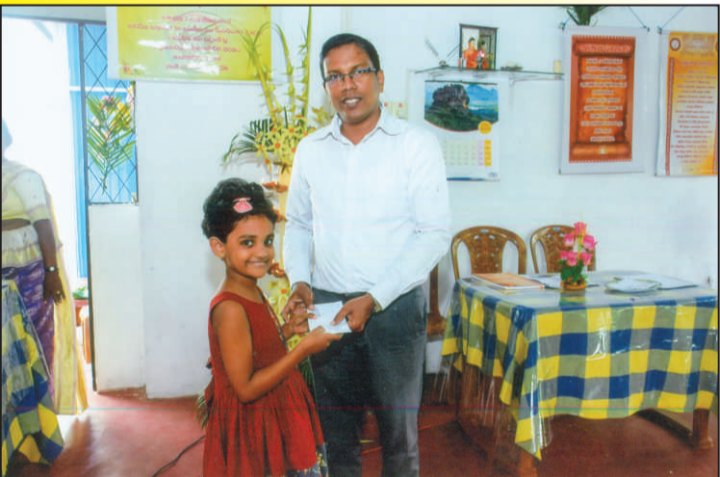
වැඩිම තැන්පත් හිමි ප්‍රමා ගිණුම් සදහා ත්‍යාග පිරිනැමීම